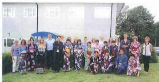
Penglais校 6th Form前にて