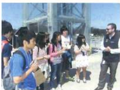
カリフォルニア科学アカデミーにて