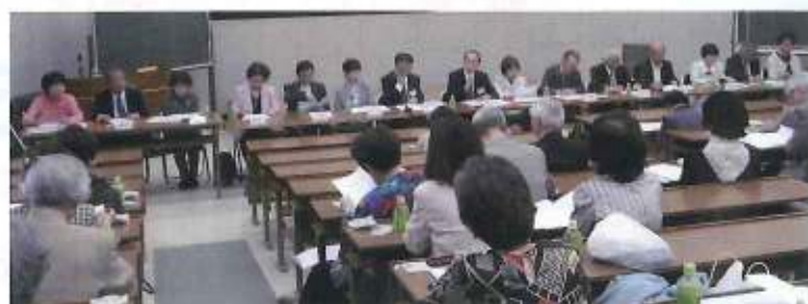
母校支援協賛金募集を満場一致で決定(平成28年定時評議員会)