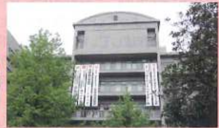
各種垂れ幕が 懸る母校正面