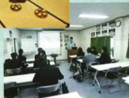
水生生物センターでの講義