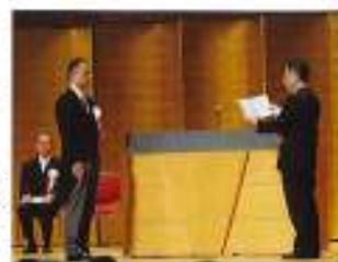
学校へ電子黒板の目録を贈呈 (記念式典にて)

その他、母校創立130周年記念誌の発行、記念品エコバッグの製作を行ったほか、昨年5月には記念クルーズ(「大手前だより」第68号に掲載済)も行いました。