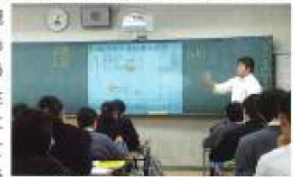
電子黒板(プロジェクター一体型)を使った授業風景(黒板の上がプロジェクター)

金蘭会から、母校に寄贈いただいた「電子黒板」は、現在進めている授業改善、「アクティブラーニング(主体的・対話的で深い学び)」にとって不可欠なものでした。今後も、授業を中心とした学校生活全体で、知識・技能はもとより、思考力・判断力・表現力などを身につけさせるとともに、学びを人生や社会に生かそうとする「学びにむかう力・人間性の涵養」を追究し、将来、社会に貢献できる人材の育成に努めていきたいと思っております。ありがとうございました。