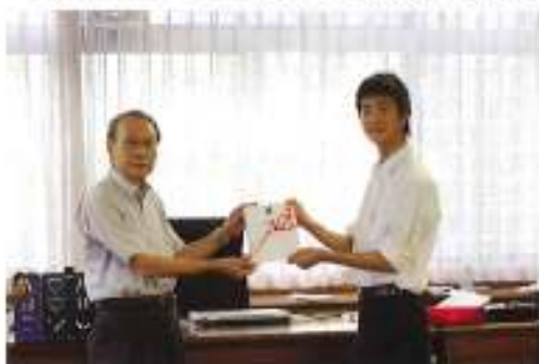
金蘭会から海外派遣支援金を贈呈

その後の文化祭でのポスター発表等を通じて多くの生徒が世界の最先端を共有することができました。あらためて感謝申し上げます。