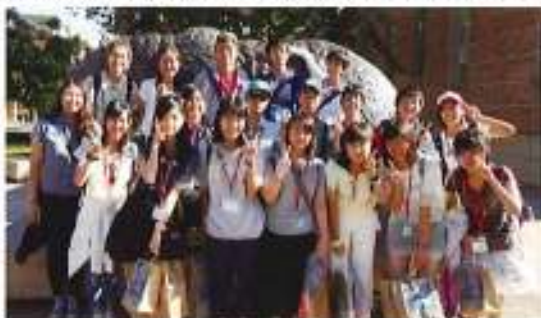
カリフォルニア大学ロサンゼルス校にて

がキャンパス内を行き交い、彼らが今学んでいることや、将来の夢といったことを聞く機会を持つことができ、研修に参加し