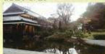
大手前B7世話役一同

最新情報は同窓会HPをご確認ください。 https://otm1987.amebaownd.com ふるってご参加くださいませ。