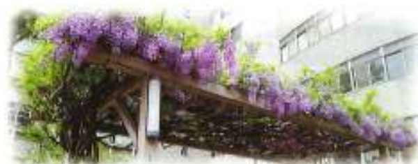
今年もきれいに咲きました(校庭の藤棚)