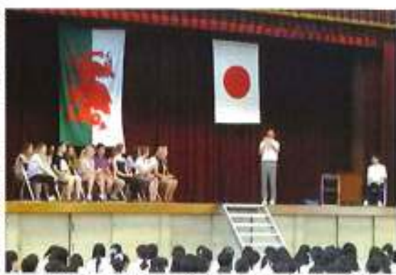
ベングライス校のメンバーを迎えて(大手前高校体育館)

で歓迎集會が行われました。8日にはバスで淡路島へ。北淡震災記念館、渦の道、大塚国際美術館の見学などを行いました。9日・10日はホストファミリーと過ごし、外食や京都観光、カラオケ、緑日などそれぞれに楽しい時間を持ったようです。11日にはバスで奈良へ。東大寺や春日大社宝物殿を見学し、篆刻体験もし、多くの日本文化に触れました。12日には今回唯一の宿泊体験で本校生徒23名とともにあべのハルカスを見学後、天正寺というお寺に向かいました。住職のお話や座禅体験の後は徒歩で銭湯へ。希望者のみでしたが、何度も何度も湯船に入り日本の銭湯を満喫している様子でした。14日のフェアウェルパーティーで名残を惜しんだ後、15日に関西空港より帰国の途につきました。