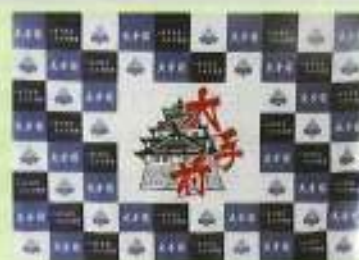
大手前高校の玄関に飾られているタペストリー(色は大手前カワの花柄)