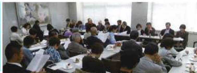
決算報告、事業計画などが承認された定時評議員会 (平成29年4月22日 金蘭会ホール)