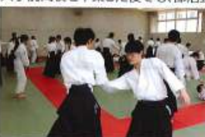
(第5回OB・OG稽古会/懇親会開催)

平成19年に合気道部の前身である合気道同好会が設立され、今年度で合気道部も11年目を迎えます。この金蘭合気会は大手前高校を卒業した後でも、部活動で苦楽を共にした仲間、先輩、後輩、さらには歳が離れていて会ったことがない大先輩とのつながりを持てるよう、平成25年に発足しました。